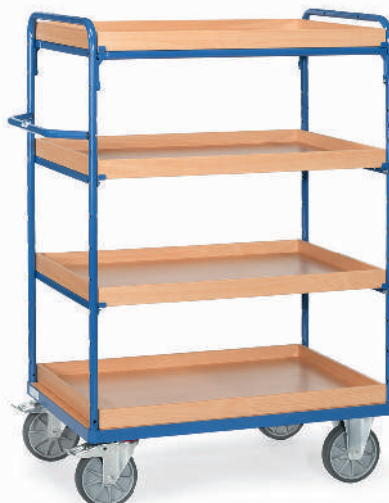
8220 | 8221 | 8222 | 8223