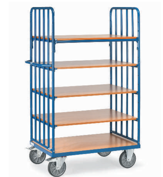
8351 | 8352 | 8353