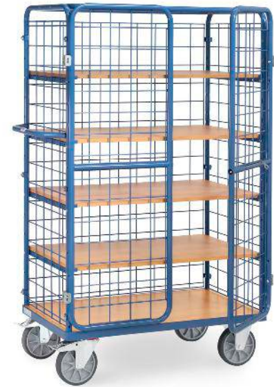
8581-3DE | 8582-3DE | 8583-3DE