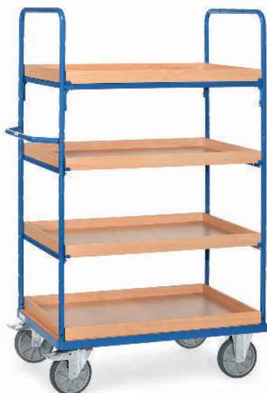
8321 | 8322 | 8323