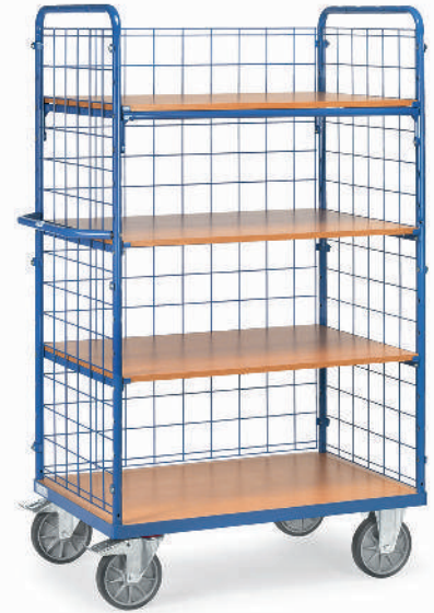
8411-1 | 8412-1 | 8413-1