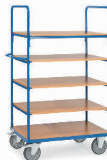
8341 | 8342 | 8343