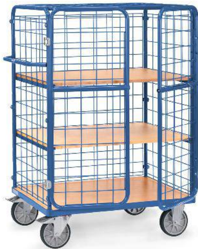
8481-3DE | 8482-3DE | 8483-3DE

Portes rabattables sur les petits côtés.