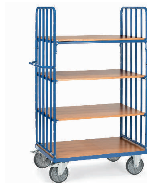
8311 | 8312 | 8313