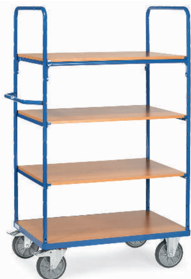
8301 | 8302 | 8303