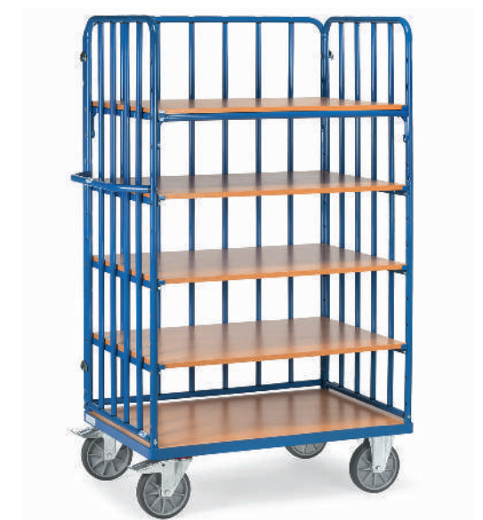
8351-1 | 8352-1 | 8353-1