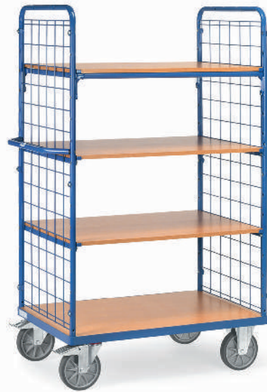
8411 | 8412 | 8413

2 petits côtés avec treillis métallique de 100 x 100 x 5 mm.