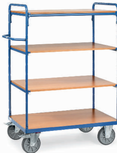
8200 | 8201 | 8202 | 8203