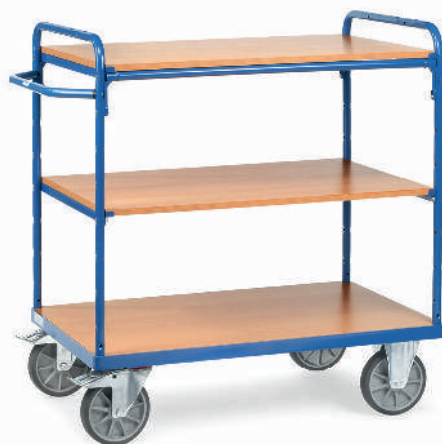
8100 | 8101 | 8102 | 8103