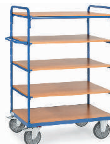
8240 | 8241 | 8242 | 8243