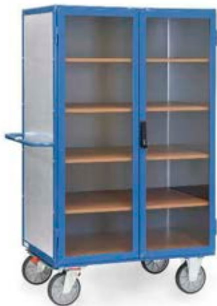
5792 | 5793