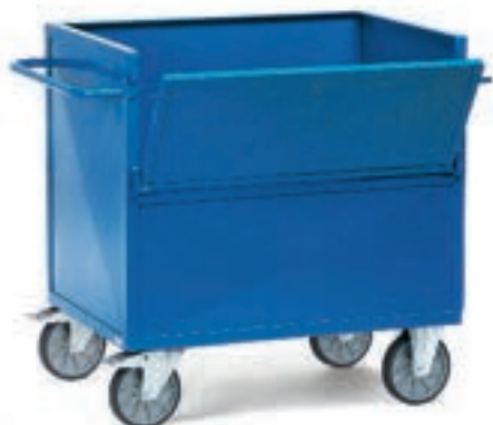
2842 | 2843