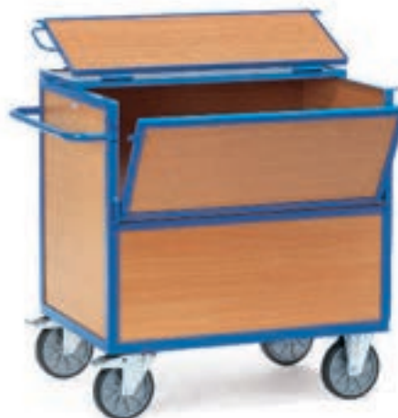
2852 | 2853