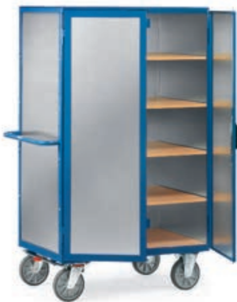
5592 | 5593