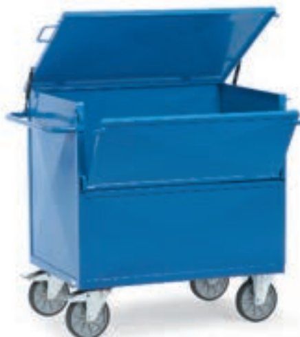
2862 | 2863