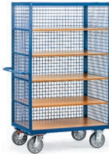
3392 | 3393