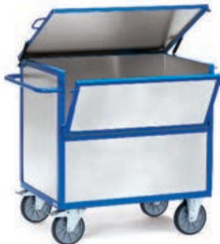
2832 | 2833