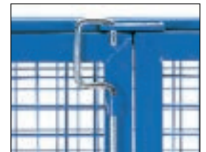
Fermeture par barre verticale verrouillage par cadenas, mise en place aisée.