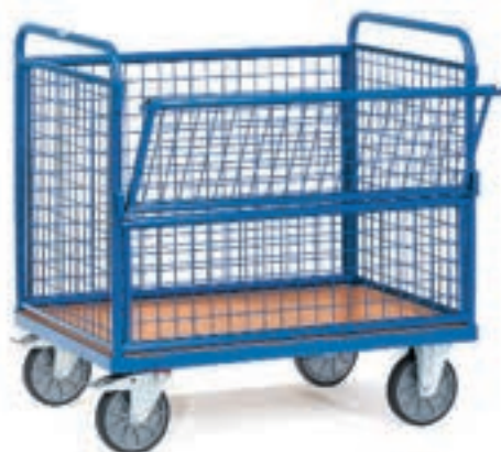
2772 | 2773

Comme 2762/2763, ridelles et couvercle en mélaminé surface effet hêtre.