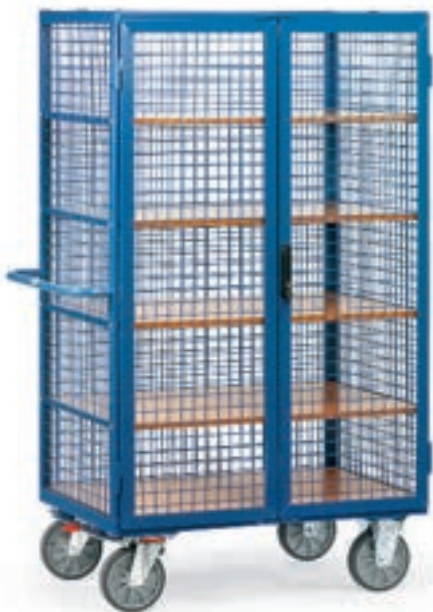
5392 | 5393