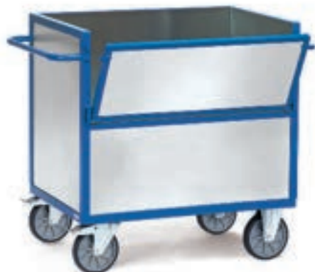
2822 | 2823