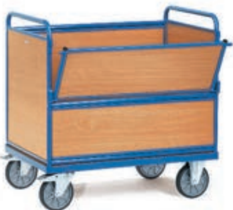
2872 | 2873