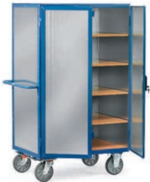
5492 | 5493