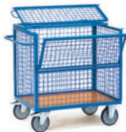
2762 | 2763