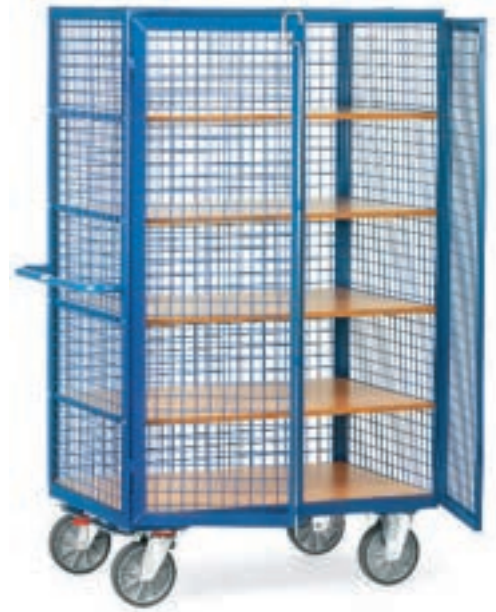
4392 | 4393